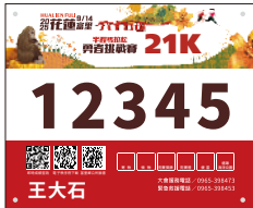
金針勇士21K 高山半馬極限組男子組