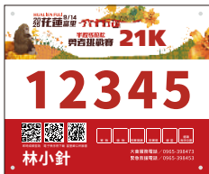
金針勇士21K 高山半馬極限組女子組