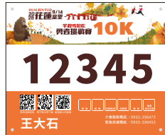
勇敢先鋒10K 山坡挑戰組男子組