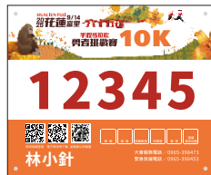
勇敢先鋒10K 山坡挑戰組女子組