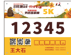
快樂嚮導5K 山腳樂活組男子組